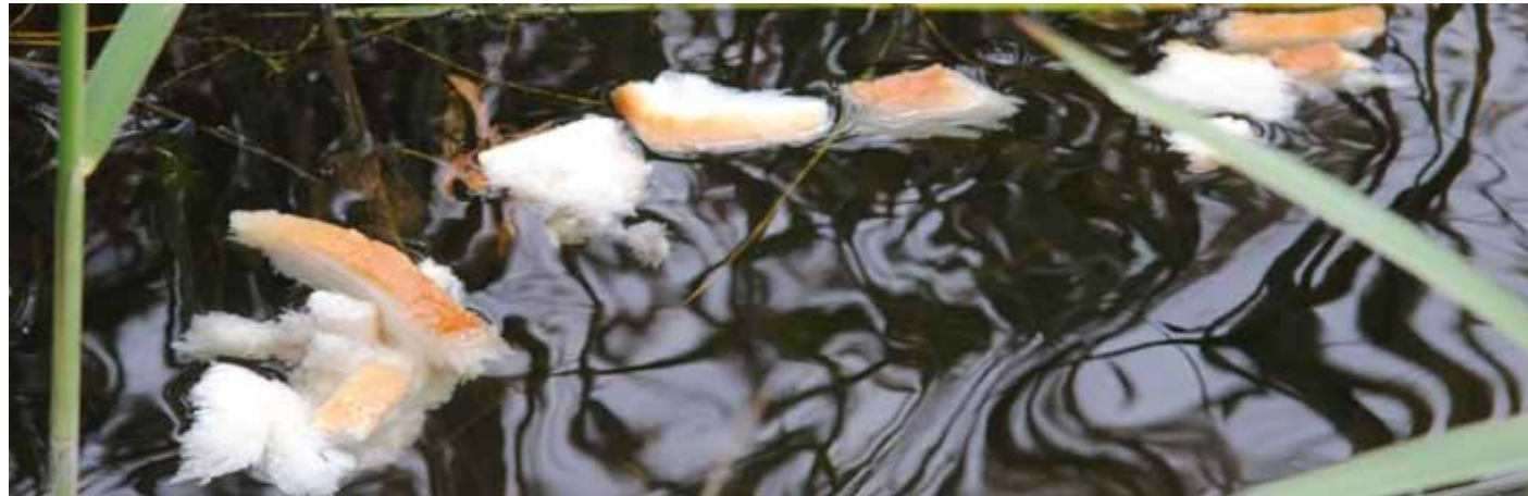
Door wat broodkorsten te strooien, krijg je ruisvoorn vaak al snel aan het azen.

problemen kunt landen. Het monteren van een dunnere onderlijn is overbodig.