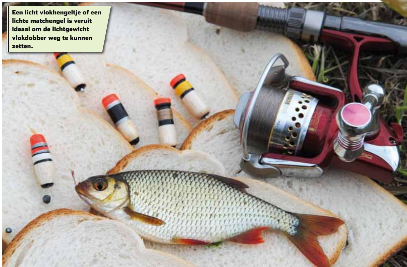
Een licht vlokhengeltje of een lichte matchengel is veruit ideaal om de lichtgewicht vlokdobber weg te kunnen zetten.

je vistas ontbreken. Na de ruisvoorn terug te hebben gezet, werp je vrolijk weer een nieuwe vlok in. Vang je na verloop van tijd minder en worden de ruisvoorns schuwer, vis dan eens wat verder van het gevoerde brood vandaan. Iets dieper vissen wil ook wel eens werken. In dat geval maak je een bal brood nat en voer je deze, zodat er meer brooddeeltjes op half water gaan zweven of zinken. ◀